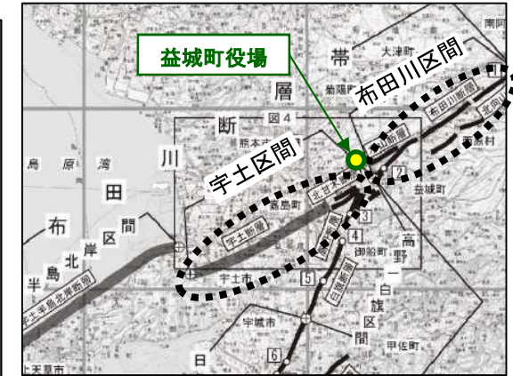
布田川断層帯等の区分