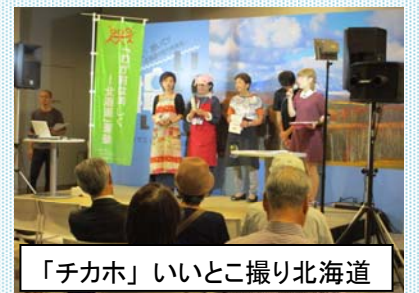
「チカホ」いいとこ撮り北海道