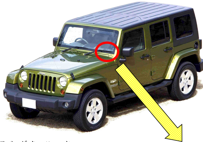
助手席用エアバッグインフレーター