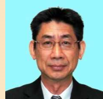
津山 恭之 奈良市副市長