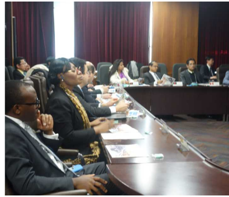
② <民間企業のプレゼンを聞く在京大使等>