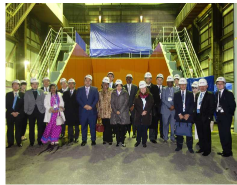
⑥ <在京大使等の集合写真>

問合せ先：国土交通省総合政策局国際政策課（グローバル戦略） 宇佐見、樋口（内線 25225, 25224） TEL：03-5253-8111（代表）03-5253-8316（直通） FAX：03-5253-1562