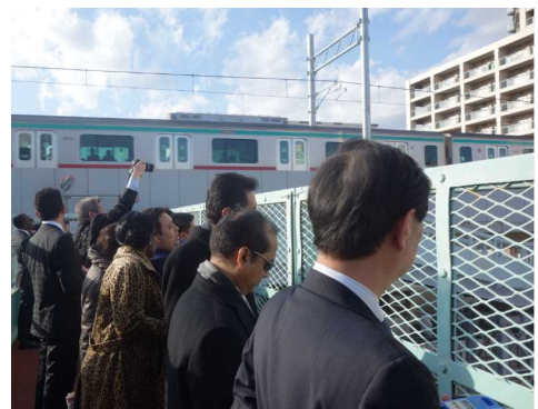
④ <連続立体交差視察の様子>