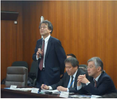
① <花岡国土交通審議官 挨拶>