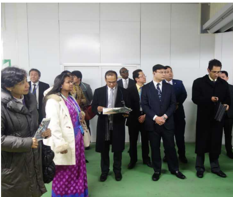
⑤ <仮設地下自由通路視察の様子>