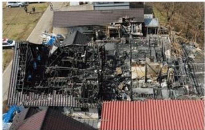
(出典) 総務省消防庁 平成21年版 消防白書 写真の掲載については著作権者の許諾を得ています。