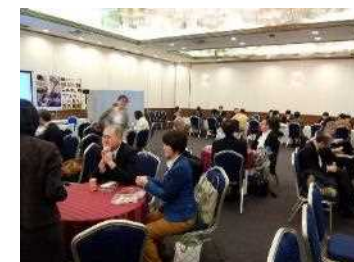
事例発表終了後の 昼食休憩時間を活用した交流