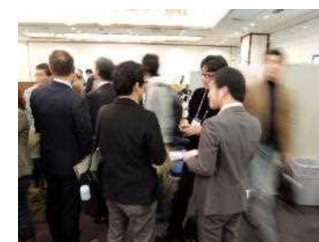
ブース移動時間の交流