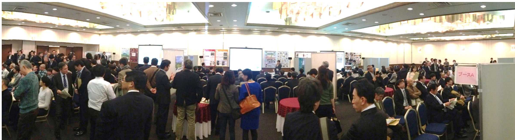
会場を5つのブースに分け、5つの時間帯に割り振り進行。参加者は関心のあるテーマのブースに移動し、発表に耳を傾けていた。