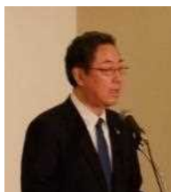
山谷 吉宏 北海道副知事