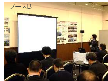
ブースB みなとオアシス苫小牧運営協議会 大西 育子氏