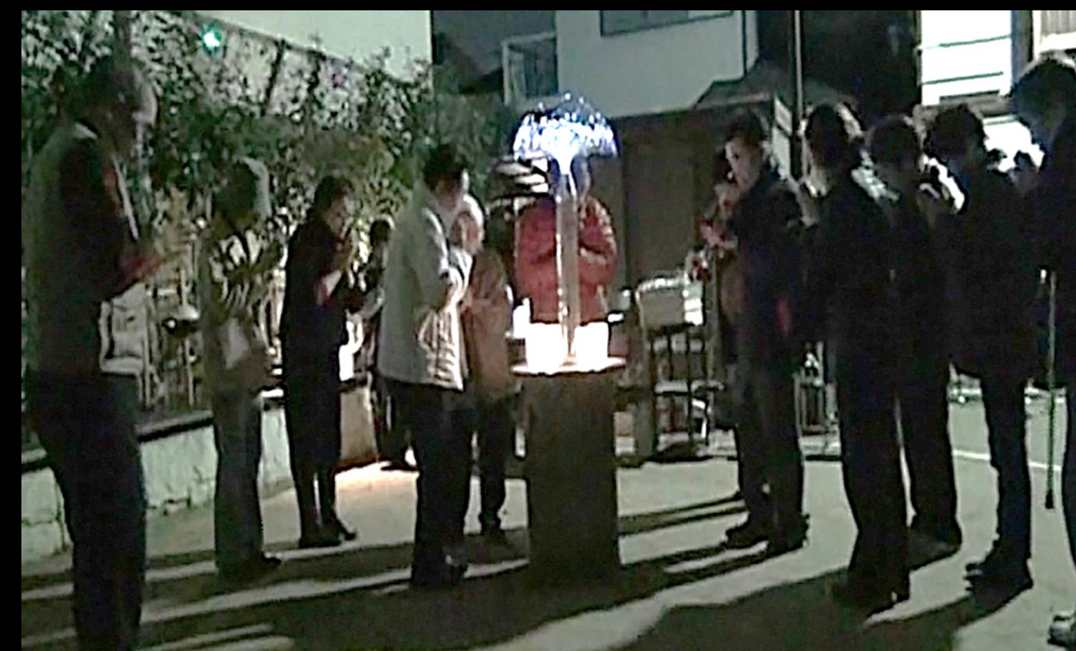
約200㎡の小さな「ももに広場」を舞台に展開される様々なイベント