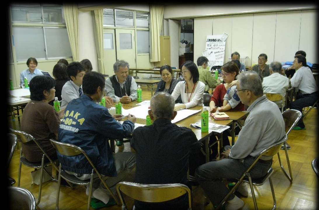
広場づくりのワークショップ