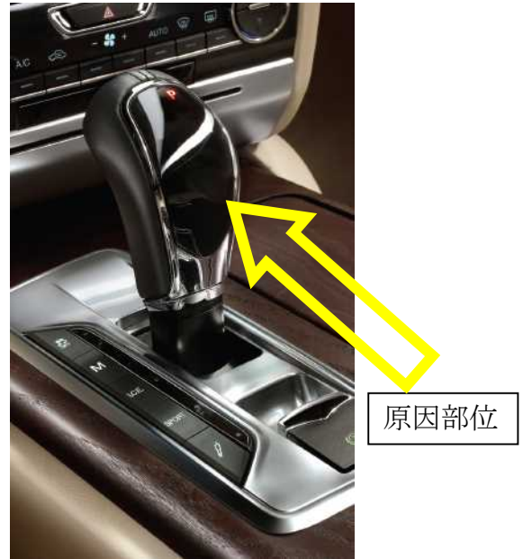
トランスミッションのギア位置の表示部位