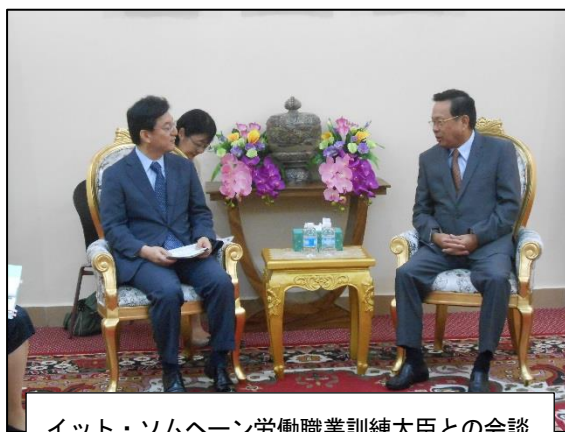
イット・ソムヘーン労働職業訓練大臣との会談