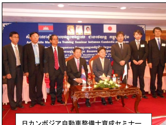
日カンボジア自動車整備士育成セミナー