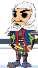
敦賀市公認キャラクター よっしー