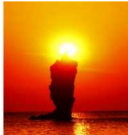
夕日がローソクに火を灯したような感動的な瞬間