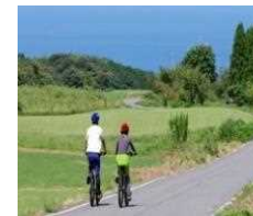
山から海岸まで四季折々の景色を楽しむ