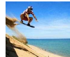
鳥取砂丘で初心者でも大丈夫