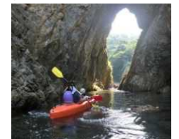
浦富海岸の透明度は最高水準