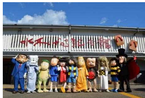
※水木しげるロード ◎水木プロ

6日目 松江市発 → 出雲大社(出雲大社、昼食) → さんべさん 三瓶山《国立公園》(トレッキング、泊) [ ・ 等1時間] [ 等1時間]