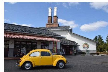
※オプション ◎青山剛昌ノ小学館 青山剛昌ふるさと館