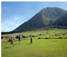
トレッキングでさわやかな自然を満喫