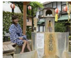
様々なロケーションの温泉が楽しめる