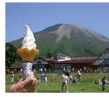
サイクリングの合間にほっと一息