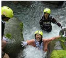
清流で自然の豊かさを体感(夏)