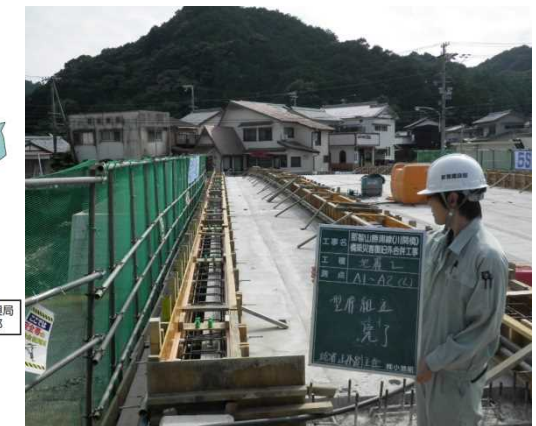
現場立会状況 (各施工段階の確認や施工方法の相談等)