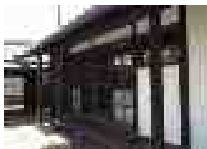
古民家を宿泊施設に改装して運営(明日香村おもてなしファンド)