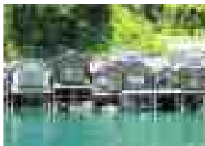
舟屋をカフェ・宿に改装して運営(伊根 油屋の舟屋「雅」)