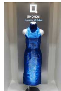
人工合成クモ糸繊維QMONOS™が使われた世界で初めてのドレス（2013年5月発表）。