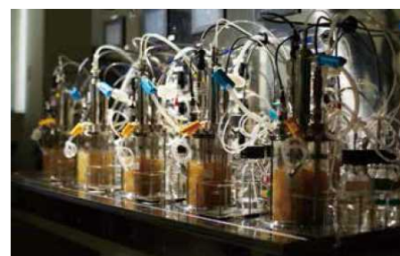
人工合成クモ糸繊維QMONOS™の製造工程。微生物に合成したクモ糸タンパク質のDNAを導入し、培養して数を増やす。