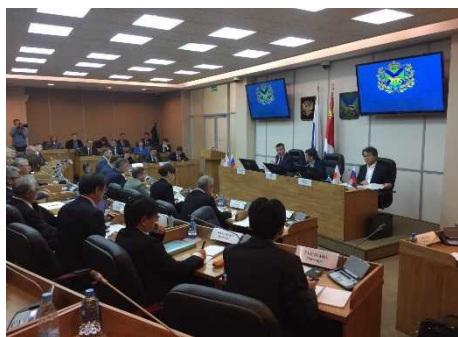
政府間対話の様様

冒頭、ウラジオストクの開発コンセプトについて、ロシア側より説明があり、それを踏まえた意見交換を行った後、日露協力案件の候補となりうる交通渋滞対策、住宅整備等の各案件についてロシア側から概要紹介がありました。その後、日露双方で今後の日露協力案件の具体化に向けた意見交換を実施し、今後も関係者間の協議を継続することで一致しました。