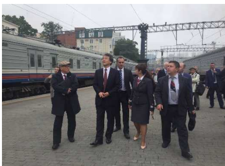
ウラジオストク駅視察の様様

日露協力案件形成の可能性を探るため、政府間対話に先立ち、6日午後、ウラジオストク鉄道駅、ウラジオストク港、港湾地区の未開発地、廃棄物処理施設、住宅展示場等を視察しました。