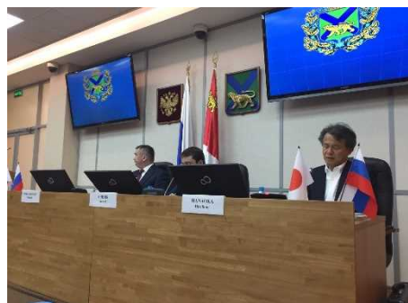
政府間対話の様様