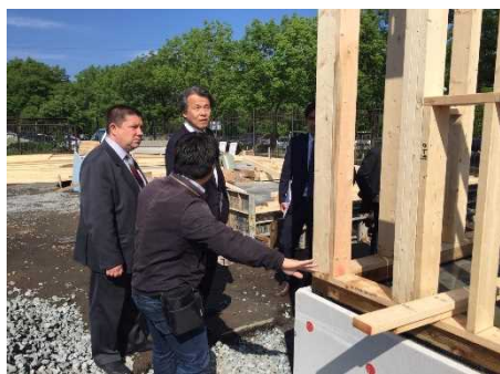
住宅展示場視察の様様