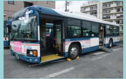
ノンステップバス

○ノンステップバス・リフト付きバスの導入 補助率：1／4又は補助対象経費と通常車両価格の差額の1／2のいずれか低い方（上限140万円）