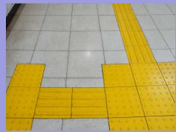
視覚障害者誘導用ブロック