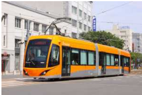
<低床式車両の導入>