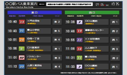
発車案内表示システム