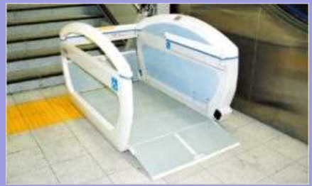
車椅子用階段昇降機