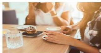
いつでも使える 会員優待サービス