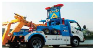
車社会の セーフティネット