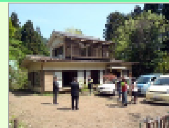
【移住者に売却・賃貸】