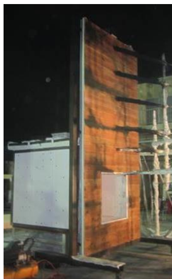
木材ファサード試験体の設置例