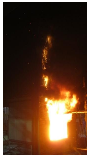
無処理木材の火災性状の一例 (燃焼が垂直方向に拡大)