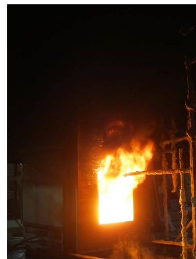
難燃処理木材の火災性状の一例 (開口噴出火炎に直接炙られる箇所 のみが燃焼) (但し、経年劣化はしていない状況)