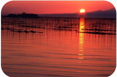
有明海の夕景とノリ養殖