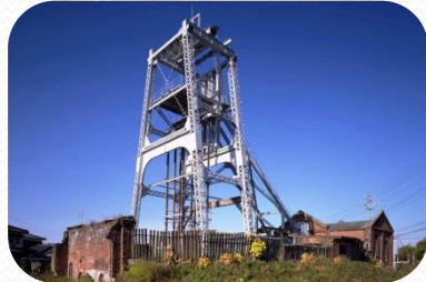
宮原坑跡(世界文化遺産)