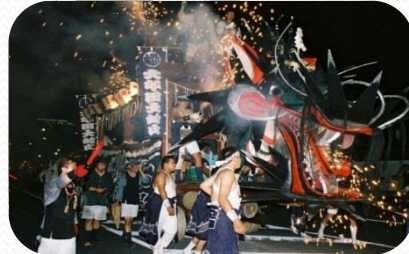
おおむた『大蛇山』まつり