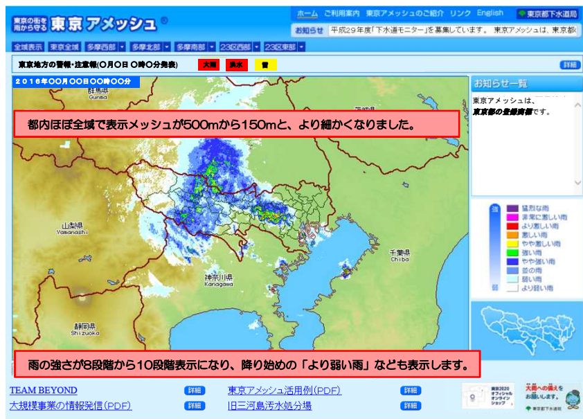
観測精度が向上した「東京アメッシュ」パソコン版の画面(イメージ)

この度、最新式レーダーの導入とシステムの再構築が完了し、観測精度が向上した「東京アメッシュ」の配信を開始しました。さらに、より操作しやすく、より見やすくした「東京アメッシュ」スマートフォン版を構築し、本年4月より配信しています。