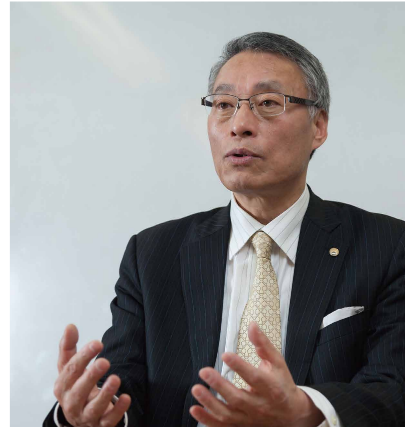
不動産リサーチ・アンド・アプレイザル(株) 代表取締役

不動産鑑定士の資格は専門性が高いといわれます。しかも、さまざまな変化を不動産の価格に反映させるには、身近で起こっていることを、世界的な潮流にまでつなげられるのか、敏感な感性とその意味を捉える学問的な基盤が必要です。自分の知識を広めるには、逆説的かも知れませんが得意分野の精度を高めることが近道かもしれません。また、公益社団となった地域会には、今までにない仕事の可能性が開けています。利益からではなく、社会貢献というキーワードで物ごとを捉えたと違違う世界が見えるのです。ちょっとした気づきが新たな可能性を拓く契機となります。仲間を見つけ、積極的にトライしてください!