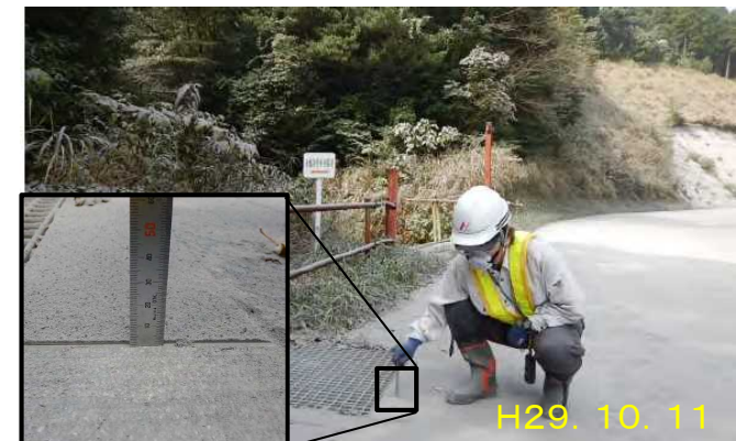
地上からの現地調査状況