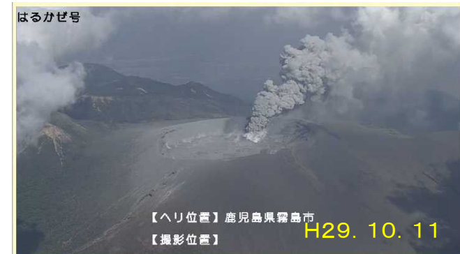
九州地方整備局ヘリからの降灰調査状況