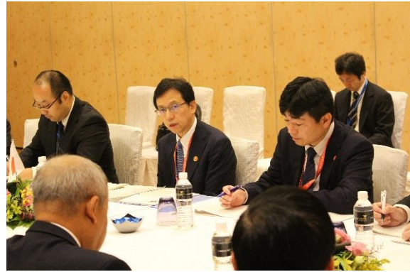
レ・ディン・トー・ベトナム交通運輸副大臣との会談