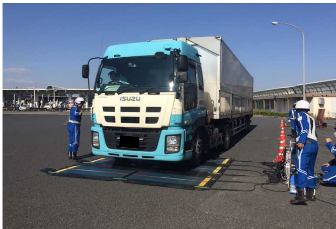
②【東日本高速道路(株)】新座本線料金所