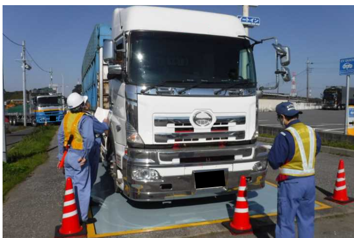
⑤【千葉国道事務所】八千代車両取締基地