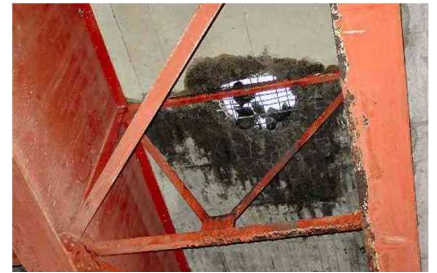
<上図：橋（床版）損傷の例>

連絡協議会では、道路構造物の劣化を加速させる主要因である違法な重量超過車両への取締りを強化しており、今回新たに埼玉県及び関東運輸局(東京運輸支局)が参画した同時合同取締を実施しました。今後も道路インフラを守るため、大型車両の通行適正化を推進してまいります。