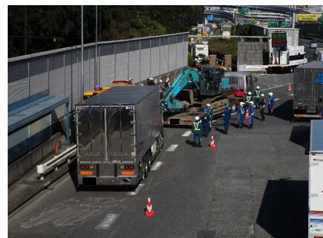
⑥【首都高速道路(株)】大井本線料金所