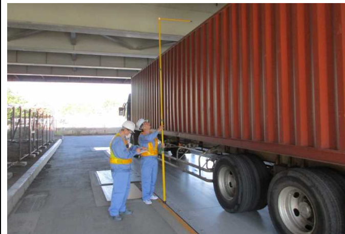
③【東京国道事務所】辰巳車両取締基地