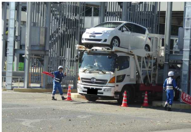
①【中日本高速道路(株)】八王子料金所