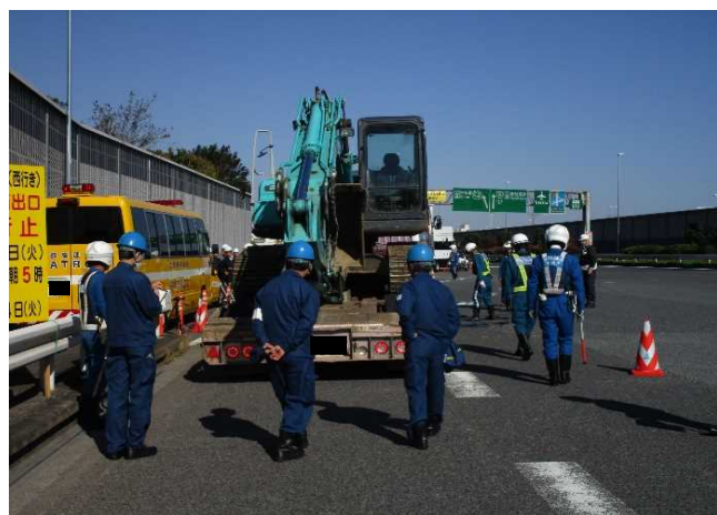
④【首都高速道路(株)/東京運輸支局】大井本線料金所