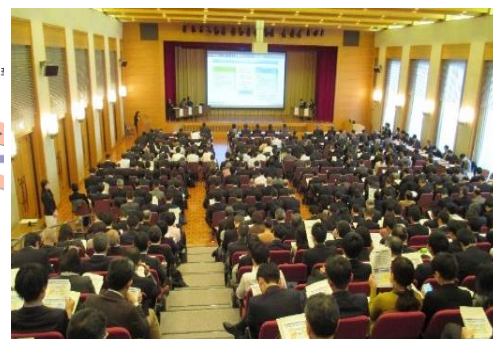
【平成28年度コンセッション事業推進セミナー 開催の様子】