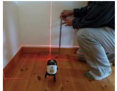
「床の傾きを計測する」調査機器