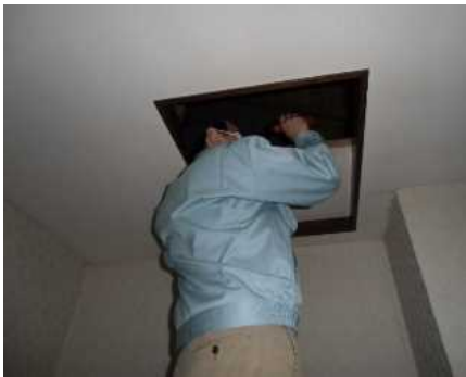
「小屋組・梁」調査の様子