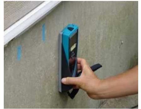
「基礎配筋」の調査機器