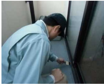
「外部（バルコニー）」調査の様子