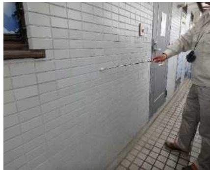
「外部（外壁）」調査の様子