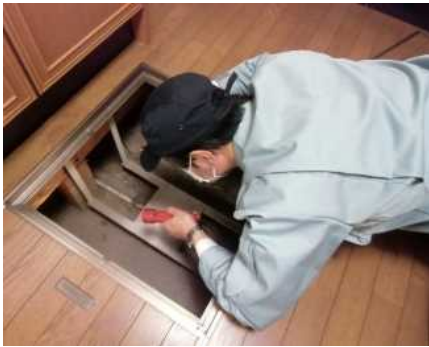
「土台・床組、基礎」調査の様子