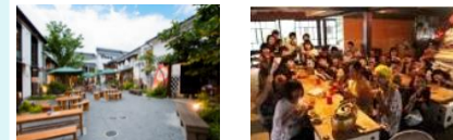
* 長野市「パティオ大門」 * 活性化施設(イメージ)