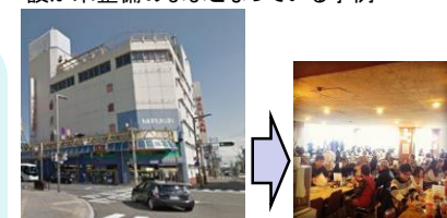
百貨店の撤退後、地元企業が転貸権・管理権を得て、商業、レストラン等の運営を継続した事例(岩手県花巻市)

市町村が、既存建物・設備 の有効活用など機能維持 に向けて手を打てる機会を 確保