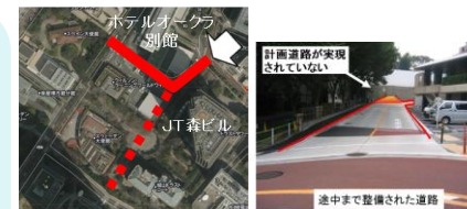
沿道の開発が計画どおりに進まず、地区施設が未整備のままとなっている事例

民間が整備すべき都市計画 に定められた施設を確実に 整備・維持 (都市機能をマネジメント)