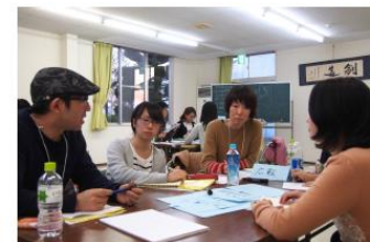
住民によるワークショップ

民間が整備すべき都市計画 に定められた施設を確実に 整備・維持 (都市機能をマネジメント)