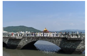
【紀州東照宮例大祭（和歌祭）】

国指定名勝「和歌 わか の浦 うら 」や、国指定重要文化財 きみいでら 紀三井寺 ごこくいんたほうとう 「護国院多宝塔」及びその周辺地域と、紀州東照宮 きしゅうとうしょうぐうれい 例 たいさい 大祭や紀三井寺境内の湧水の保全活動、和歌浦湾の漁業 のぼり と結びついた幟 のぼり 揚げ神事等の伝統行事等からなる歴史的風致の維持向上を図るため、紀州東照宮等の歴史的建造物の保存修理や公開活用、紀三井寺周辺等の修景整備、和歌祭等の祭礼活動に係る活動支援や担い手育成に関する事業等が位置づけられています。