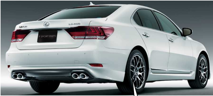
19 インチアルミホイール