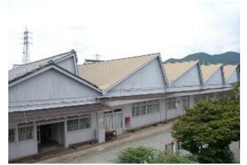
【織物産業を営むノギリ屋根工場】

重要伝統的建造物群保存地区「桐生市桐生新町伝統的建造物群保存地区」及びその周辺地域と、伝統産業としての織物産業やこれに由来する機神信仰、桐生祇園祭等の伝統的な祭礼や行事等からなる歴史的風致の維持向上を図るため、伝統的建造物の保存修理や公開活用、道路の無電柱化や舗装の美装化、織物産業の保護育成事業等が位置づけられています。