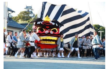
【掛川祭における三大余興の1つ「大獅子」】

国指定重要文化財「掛川城御殿」や国指定史跡「横須賀城跡」及びこれらの城下町等と、掛川祭における三大余興や三熊野神社大祭等からなる歴史的風致の維持向上を図るため、伝統的建造物の保存修理・活用、道路の無電柱化や舗装の美装化、城跡の復元等が位置づけられています。