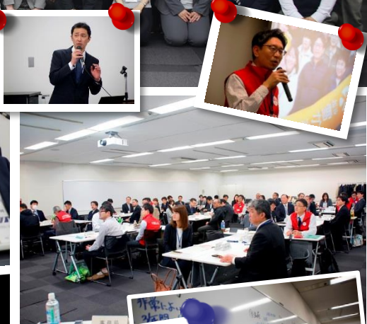
▲初めての発表で緊張したかな...