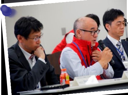
▲恒例となった「有識者トーク」では的確なアドバイスをいただいた。