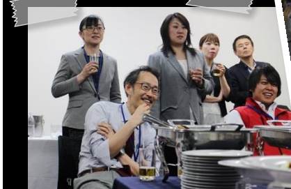
▲懇親会では○○○のワーストを披露!?