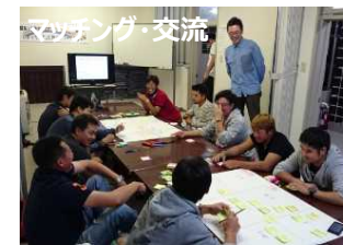
マッチング・交流

・ 多様なワークスタイル、新しいライフスタイルの実現。地元人材の育成、雇用創出、交流・定住人口増加。