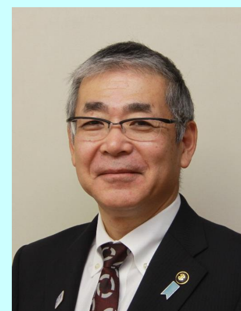
高橋 邦芳 新潟県村上市長