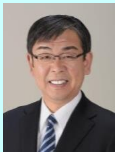
櫻井 義之 三重県亀山市長