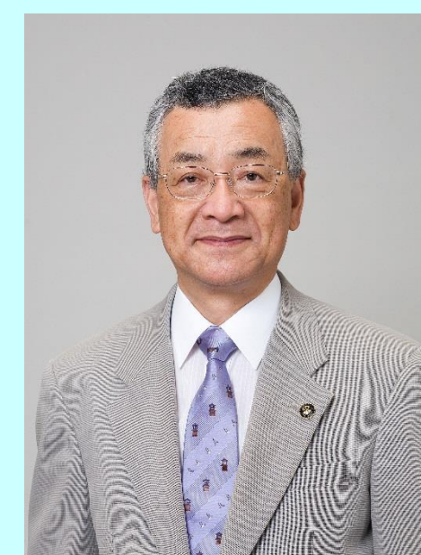
川合 善明 埼玉県川越市長