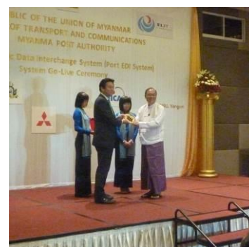
タン・スィン・マウン運輸・通信大臣より記念品を授与するあきもと副大臣