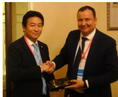
記念品交換 （あきもと副大臣：左） （コロリョフ副長官：右）