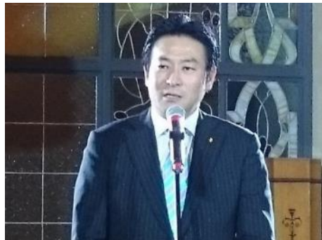
挨拶をするあきもと副大臣