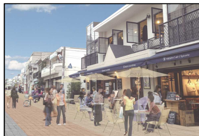
道路や公園の修景整備による奄美らしい都市空間の高質化①②