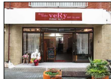
創業支援による商店街賑わい再生⑤