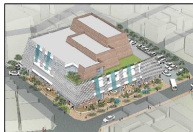
(仮称)市民交流センター整備③