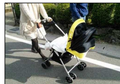
子ども連れや高齢者にとって買い物しやすいタウンモビリティの検討⑦