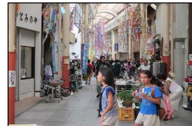
商店街や公共施設を拠点とした交流イベント開催による回遊性の向上⑨⑩