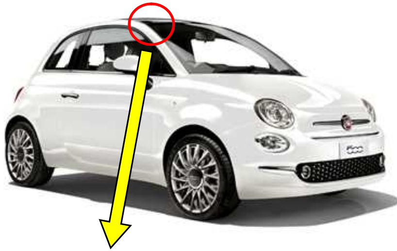
運転者席側サンバイザ