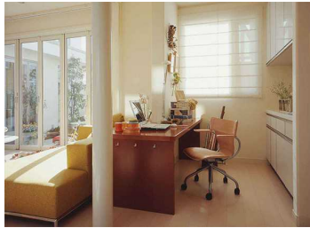
【例：自宅で会議に参加】