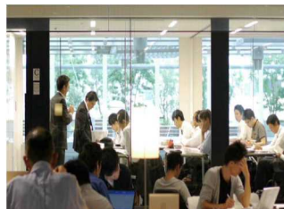
◇製品化前のアイデアの展示スペース