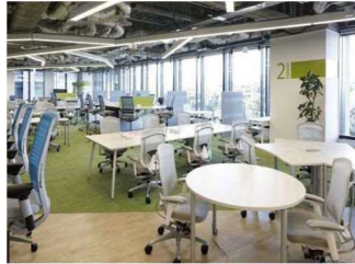
◇グループアドレスの実施