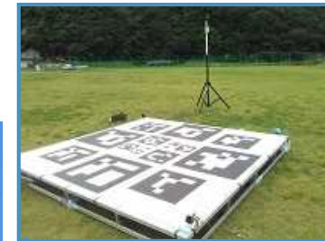
ドローンポート イメージ