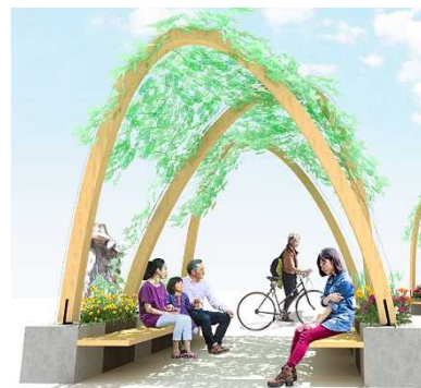
暑熱対策に資する自立型の緑化施設「沿道型」イメージ