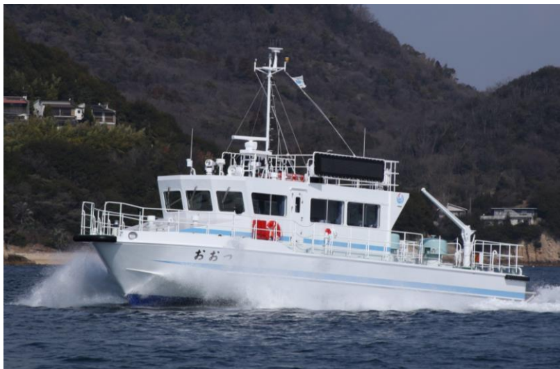
中国地方整備局所属 港湾業務艇「おおつ」