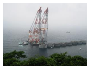
ケーソン据付時の様子