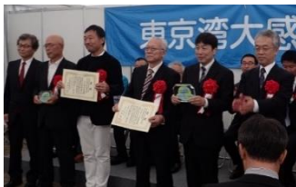
平成29年度授賞式の様子

この賞は、我が国の経済・文化の中心である首都圏都市の貴重な水辺空間がより豊かに次世代に引き継がれることを目的として、平成29年に（一財）みなと総合研究財団により創設された賞で、国土交通大臣賞、（一財）みなと総合研究財団理事長賞があり、授賞式は10月20日に横浜にて行われる予定です。