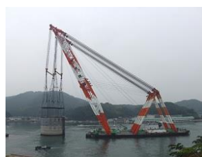
起重機船で輸送されるケーソン