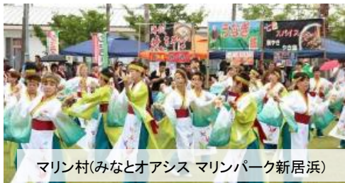
マリン村(みなとオアシス マリンパーク新居浜)

全国各地でみなとを核とした地域振興の取組が行われている「みなとオアシス」は、平成16年1月に「みなとオアシス瀬戸田（尾道市）」、「鳥取・賀露みなとオアシス（鳥取市）」を登録して以降、年々増加しています。平成29年9月には100箇所を達成し、本年7月1日に「みなとオアシス福良（南あわじ市）」、「みなとオアシス マリンパーク新居浜（新居浜市）」を登録し、全国113箇所となりました。