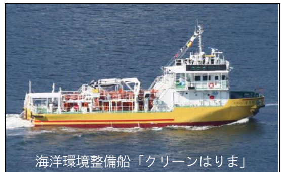
海洋環境整備船「クリーンはりま」