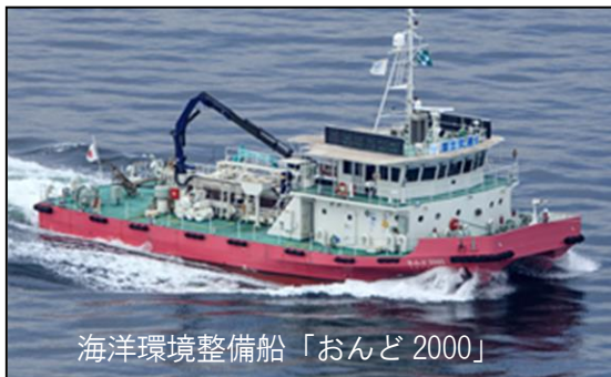
海洋環境整備船「おんど2000」

7月5日から8日にかけて、西日本に降り続いた記録的な豪雨により、広島港から呉港にかけて確認された、流木などの漂流物を海洋環境整備船「おんど2000」（中国地方整備局所属）、「クリーンはりま」（近畿地方整備局所属）で回収作業を行っています。