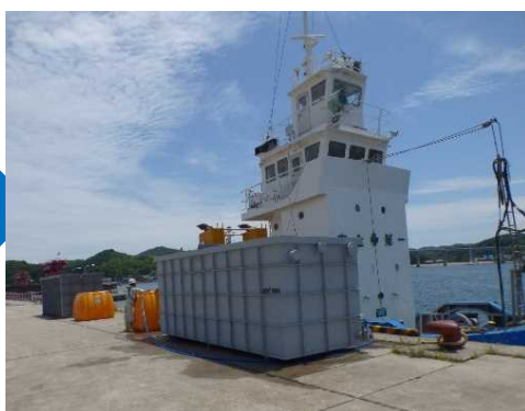
貯水・給水タンクを設置