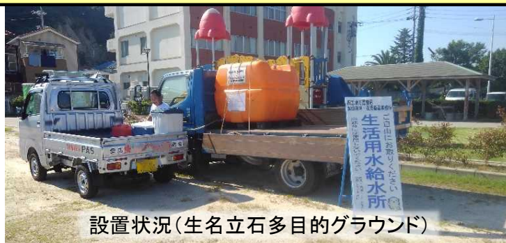
設置状況(生名立石多目的グラウンド)