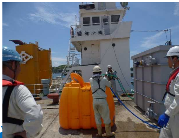
給水タンクに注水