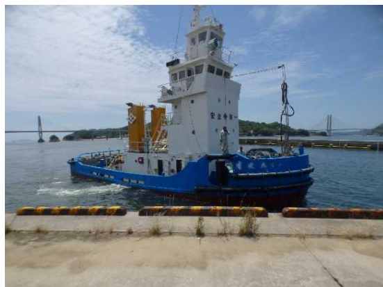
作業船により生活用水を運搬