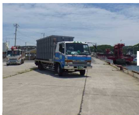
貯水・給水タンクを運搬