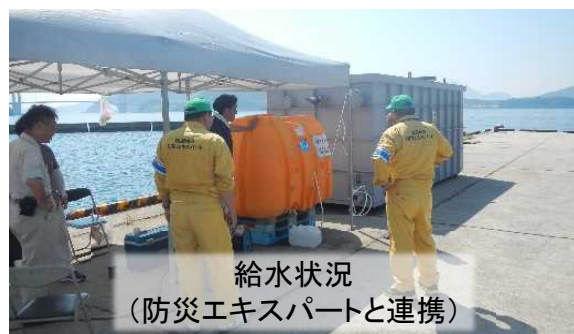
給水状況 (防災エキスパートと連携)