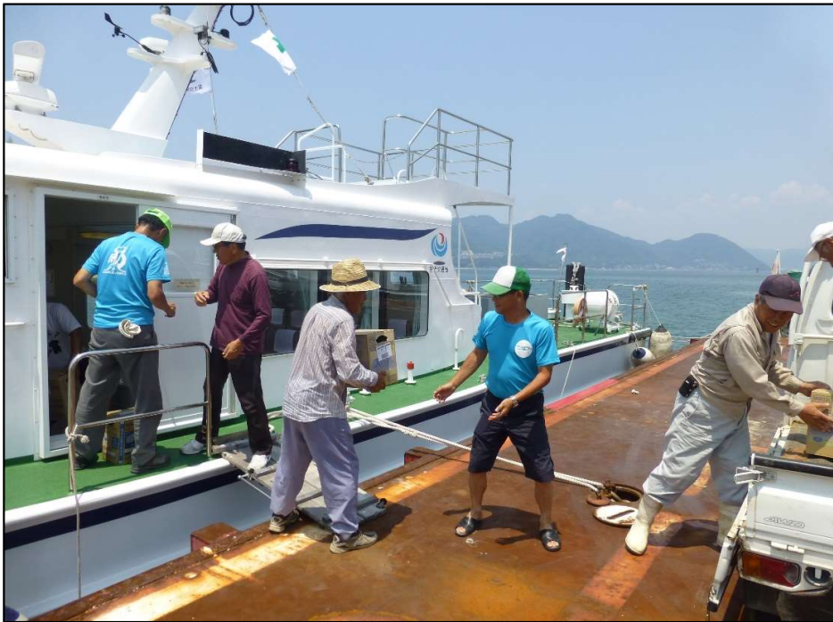
救援物資荷下ろし状況

全長 17.1m 全幅 4.2m 総トン数 19トン 近畿地方整備局 和歌山港湾事務所所属