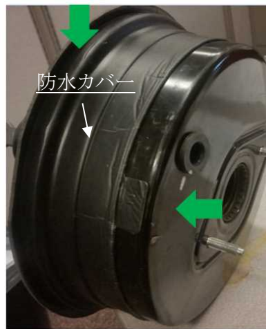
基準不適合発生箇所

ブレーキ倍力装置の防水カバーが作業要領書どおり適切に取り付けられていないものがある。そのため、当該装置に雨水がかかり、腐食して負圧が失われ、最悪の場合、制動距離が伸びるおそれがある。