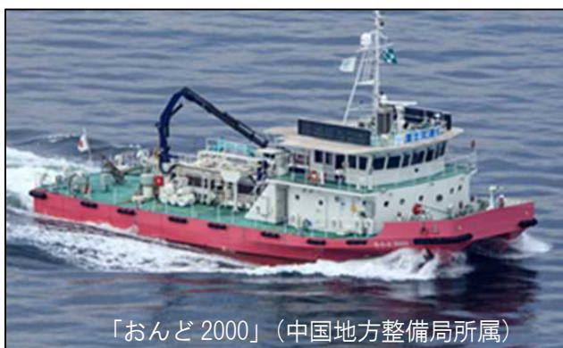
「おんど2000」（中国地方整備局所属）

また、呉港の港湾管理者である呉市からの要請に基づき、全国で初めて港湾法五十五条の三の三の規定の適用により、非常災害の場合における国土交通大臣による港湾施設の管理として、7月16日より呉港内の漂流物の回収も行っております。