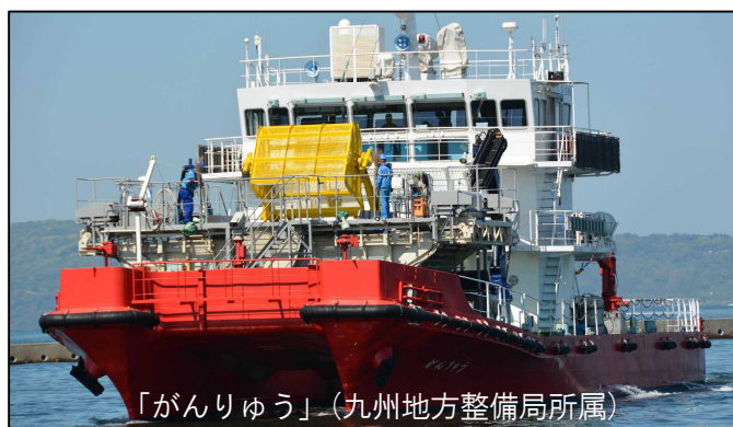
「がんりゅう」（九州地方整備局所属）