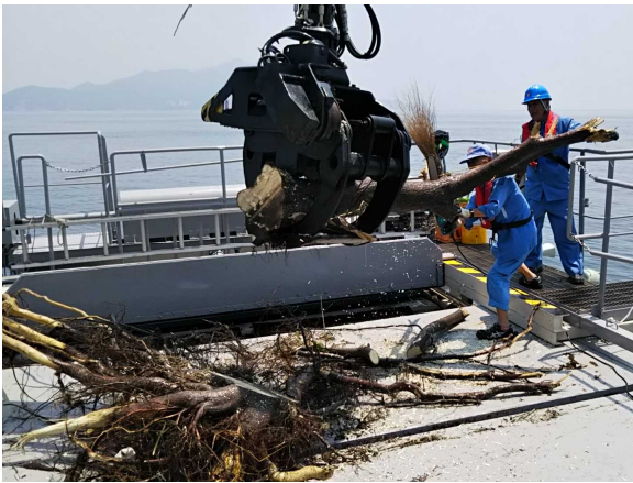
流木・葦類の回収(倉橋島付近)