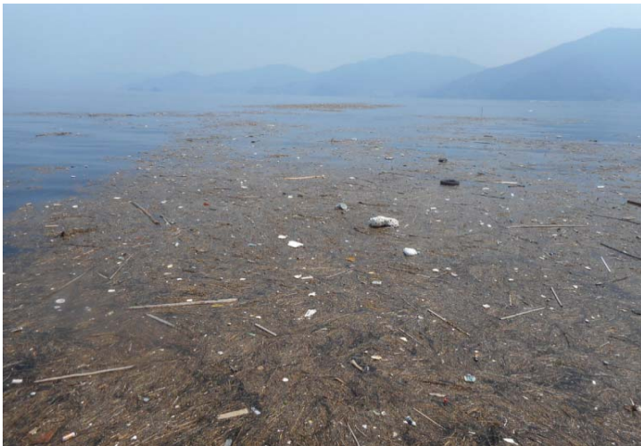
回収前(漂流物)状況

全長 33.50m 全幅 11.6m 総トン数 196トン 近畿地方整備局 神戸港湾事務所所属