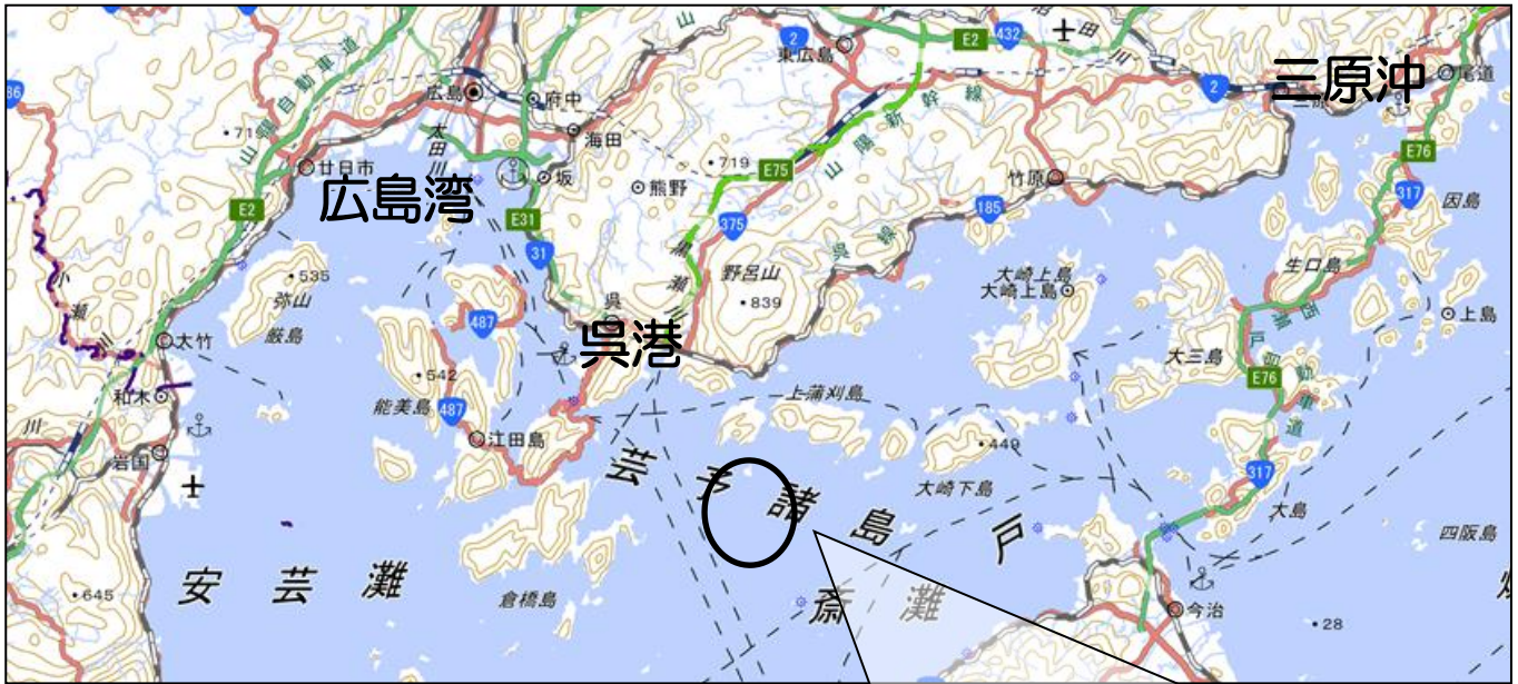
「おんど2000」中国地方整備局