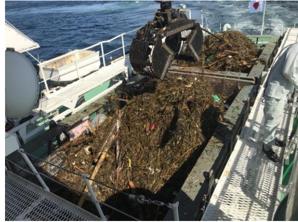
流木・葦類の回収(下蒲刈島付近)