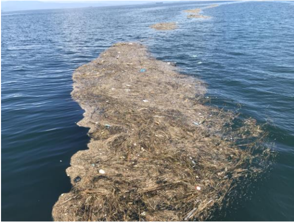
漂流物の状況(下蒲刈島付近)